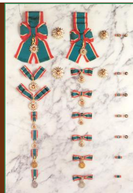
เครื่องราชอิสริยาภรณ์อันเป็นที่สรรเสริญยิ่งดิเรกคุณาภรณ์