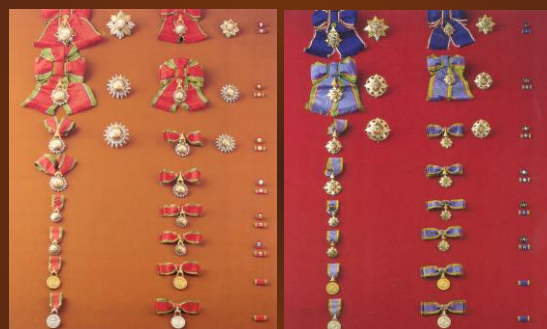
เครื่องราชอิสริยาภรณ์อันเป็นที่เชิดชูยิ่งช้างเผือก

เครื่องราชอิสริยาภรณ์อันเป็นที่เชิดชูยิ่งช้างเผือกและ เครื่องราชอิสริยาภรณ์อันมีเกียรติยศยิ่งมงกุฎไทย