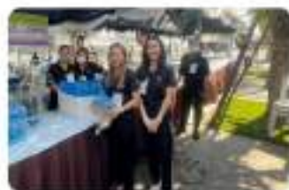
"มุ่งผลสัมฤทธิ์ จัดบริการ ประชาชน สานักค้ำ" ส่วนแผนงานและประเมินผล