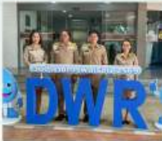
การเข้าร่วมกิจกรรมของสถาบันชาติ ศาสนาและพระมหากษัตริย์