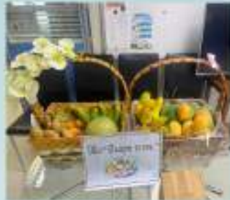
กิจกรรมส่งเสริมการใช้ชีวิตที่พอเพียง "ได้-เป็นสุข"