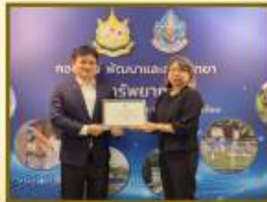
ด้านพอเพียง ส่วนวิเคราะห์คุณภาพน้ำ