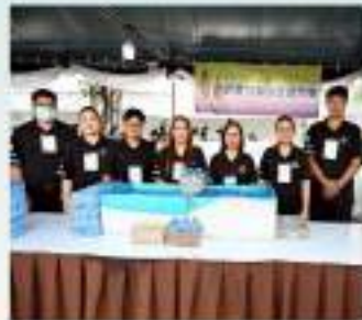
กิจกรรมจิตอาสา