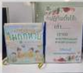
การช่วยเหลือเกื้อกูลซึ่งกันและกัน