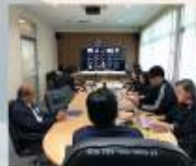
กิจกรรมได้หาความรู้เพิ่มเติมเพื่อพัฒนาการทำงานและใช้ชีวิต