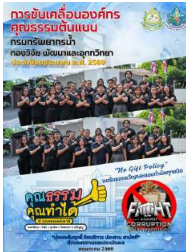
พาวเวอร์พอยท์ (PowerPoint)