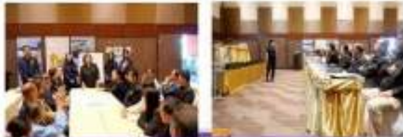
"มุ่งผลสัมฤทธิ์ จัดบริการ ประสาน สานักคัส"

ส่วนวิจัยและพัฒนาทรัพยากรน้ำ กองวิจัย พัฒนาและอุทกวิทยา