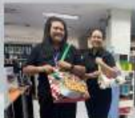
การใช้ทรัพยากรอย่างประหยัด คุ้มค่า และรักษาสิ่งแวดล้อม