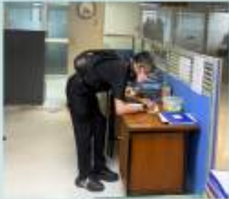
การปฏิบัติราชการตามรอบเวลาอย่างเคร่งครัด