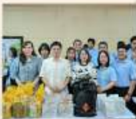
กิจกรรมทางศาสนาและประเพณีไทย