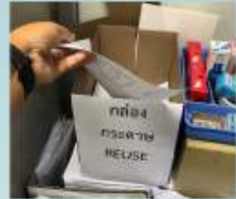
การใช้ทรัพยากรหน่วยงานอย่างประหยัดและคุ้มค่า