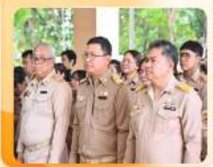
* มุ่งผลสัมฤทธิ์ จัดบริการ ประชาชน ตามหน้าที่ * ส่วนแผนงานและประเมินผล