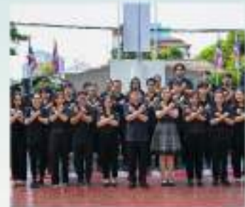
การธรมรงค์ การไม่รับของขวัญและของกำนัลทุกชนิด (NO GIFT POLICY)