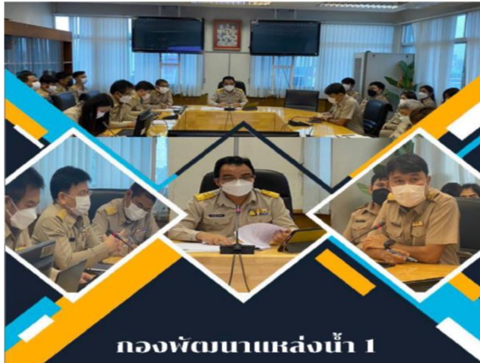
กองพัฒนาแหล่งน้ำ 1

▶ ๖. เจ้าหน้าที่กองพัฒนาแหล่งน้ำ ๑ แต่งกายชุดข้าราชการทุกวันจันทร์ โดยมีเป้าหมายจำนวนไม่น้อยกว่าร้อยละ ๘๐ ในช่วงเดือนตุลาคม ๒๕๖๖ ถึง เดือนกุมภาพันธ์ ๒๕๖๗ ผลปรากฏว่าเจ้าหน้าที่กองฯมีจิตสำนึกและมีความภาคภูมิใจในเกียรติภูมิของข้าราชการ จึงได้ให้ความร่วมมือแต่งกายชุดข้าราชการทุกวันจันทร์ในอัตราร้อยละ ๑๐๐