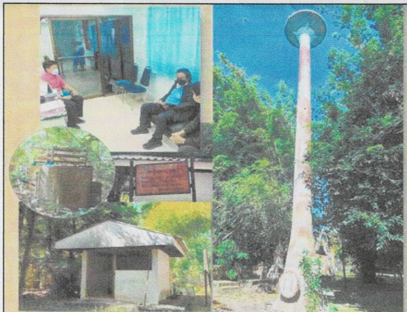
← บ้านโนนตูม