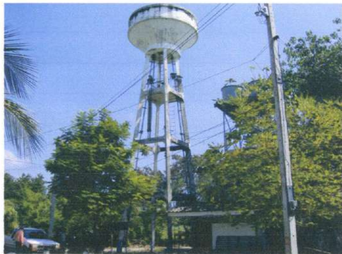
รูประบบประปาหมู่บ้านขนาดใหญ๋ บ้านเจริญสุข หมู่ที่ 6 พิกัด XUTM 628176 YHTM 1502392