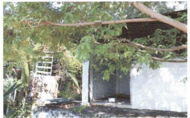
รูประบบประปาหน้าไต้ดิน บ้านคลองยายหลี่ หมู่ที่ 12 พิกัด XUTM 47P 0668283 YUTM 1498005