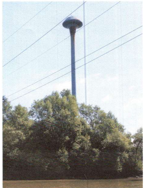
รูประบบประปาหน้าไต้ดิน บ้านคลองตาเพิ่ม หมู่ที่ 7 พิกัด XUTM 47P 0667070 YUTM 1496716