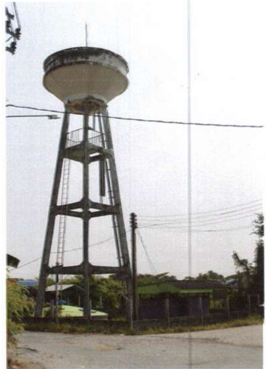
รูประบบประปาหมู่บ้านบาดาลขนาดใหญ่ บ้านใหม่ หมู่ที่ 7 พิกัด XUTM 47P 0640188 YUTM 1533666