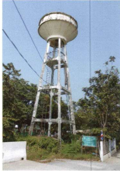
รูประบบประปาหมู่บ้านขนาดใหญ่ บ้านคอนตะลุงพุก หมู่ที่ 8 พิกัด XUTM 47P 0643959 YUTM 1533941