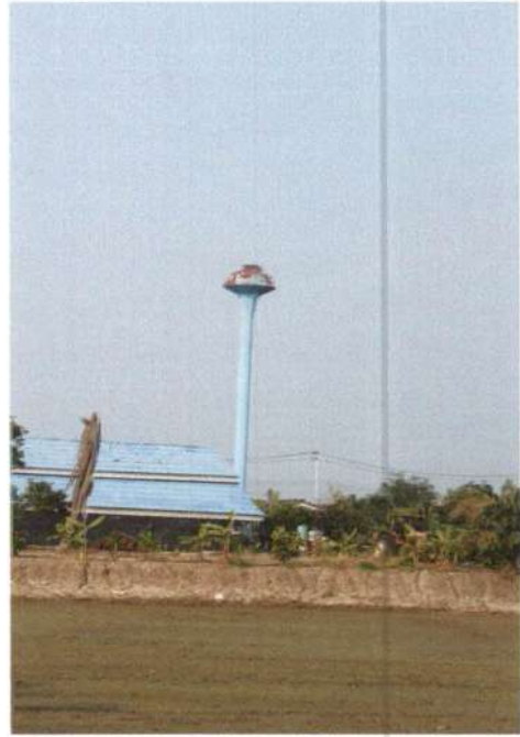
รูประบบประปาที่ได้ดิน บ้านหนองไผ่ขาด หมู่ที่ 5 พิกัด XUTM 47P 0643315 YUTM 1530638