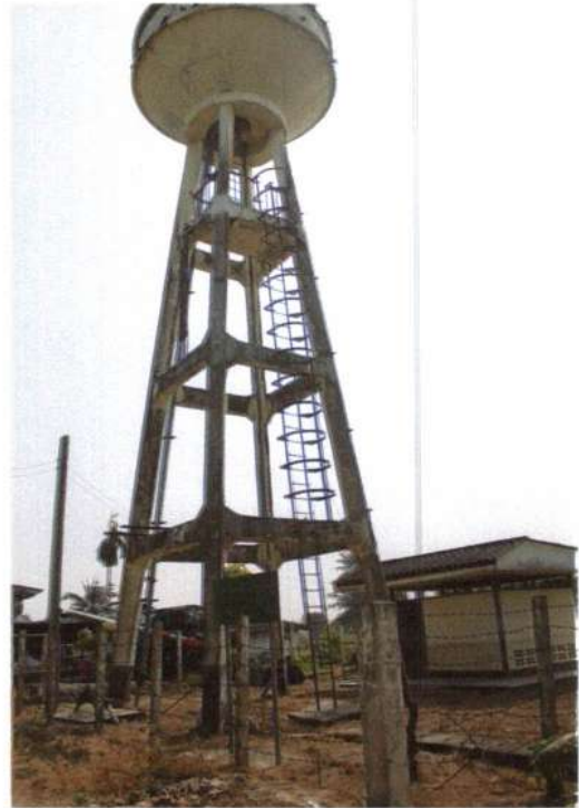
รูประบบประปาหมู่บ้านขนาดใหญ่ บ้านคลองราษฎร์ประเสริฐ หมู่ที่ 9 พิกัด XUTM 47P 0644952 YUTM 1533083

A handwritten signature in blue ink, located in the bottom right corner of the page.