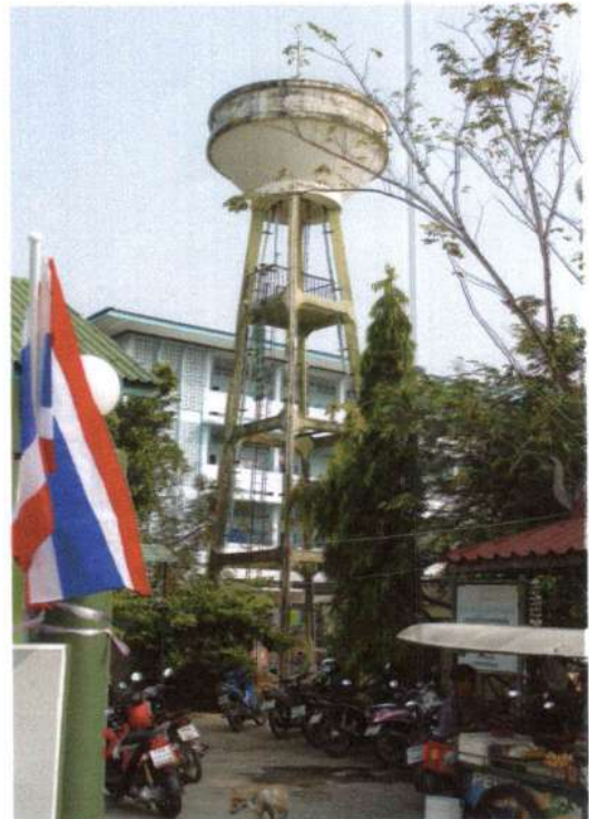
รูประบบประปาหมู่บ้านบาดาลขนาดใหญ่ บ้านใหม่ (วัดต้นเชือก) หมู่ที่ 4 พิกัด XUTM 47P 0644616 YUTM 1530438