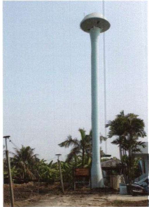
รูประบบประปาหน้าไต้ดิน บ้านคลองตาแดง หมู่ที่ 3 พิกัด XUTM 47P 0642541 YUTM 1533359